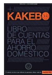
Kakebo. Editorial Blackie Books.

▶ La cuenta de septiembre está en su esplendor y no sabes en qué se te ha ido el dinero. Prueba a administrarte con la ayuda de tu agenda Kakebo, un complemento doméstico japonés.