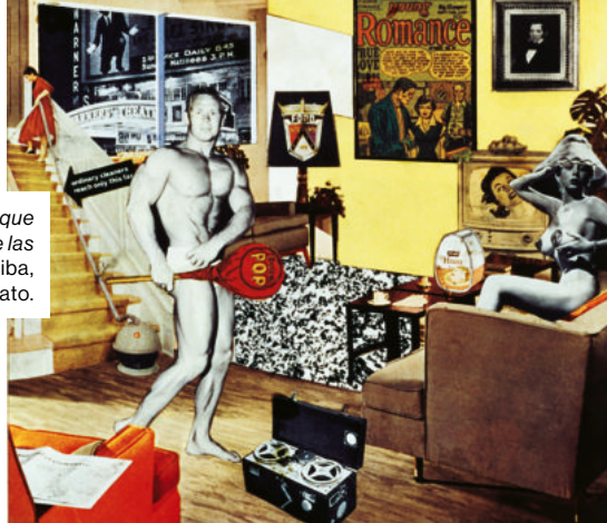
¿Qué es lo que hace que las casas... Arriba, un autorretrato.